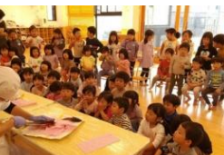
サバを解体しました