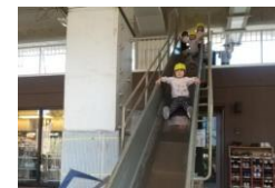
市川どろんこに行きました