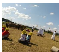
こめ：キャンプごっこ