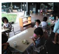
一宮どろんこ米おにぎり体験