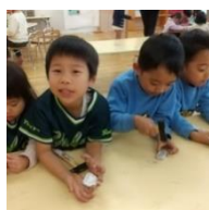
あるみほいるだま