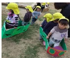
青虫電車で出発進行