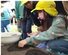
さやいんげんの種植え