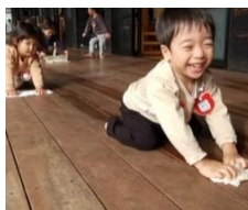
上手になった雑巾がけ