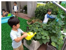
きゅうりに水やり