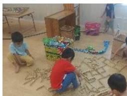
カプラで街づくり